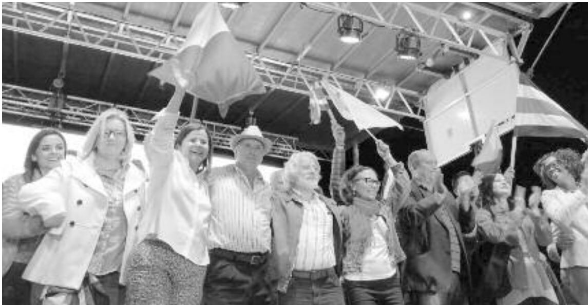
La tarima de celebración del triunfo de Carlos Alvarado refleja el carácter del nuevo gobierno: figuras del PLN y PUSC al lado de Ottón Solís, defensores del ajuste fiscal contra la clase trabajadora. El FA, representado con Patricia Mora, de nuevo a la cola de la burguesía “progresista” y esta vez al lado del bipartidismo.