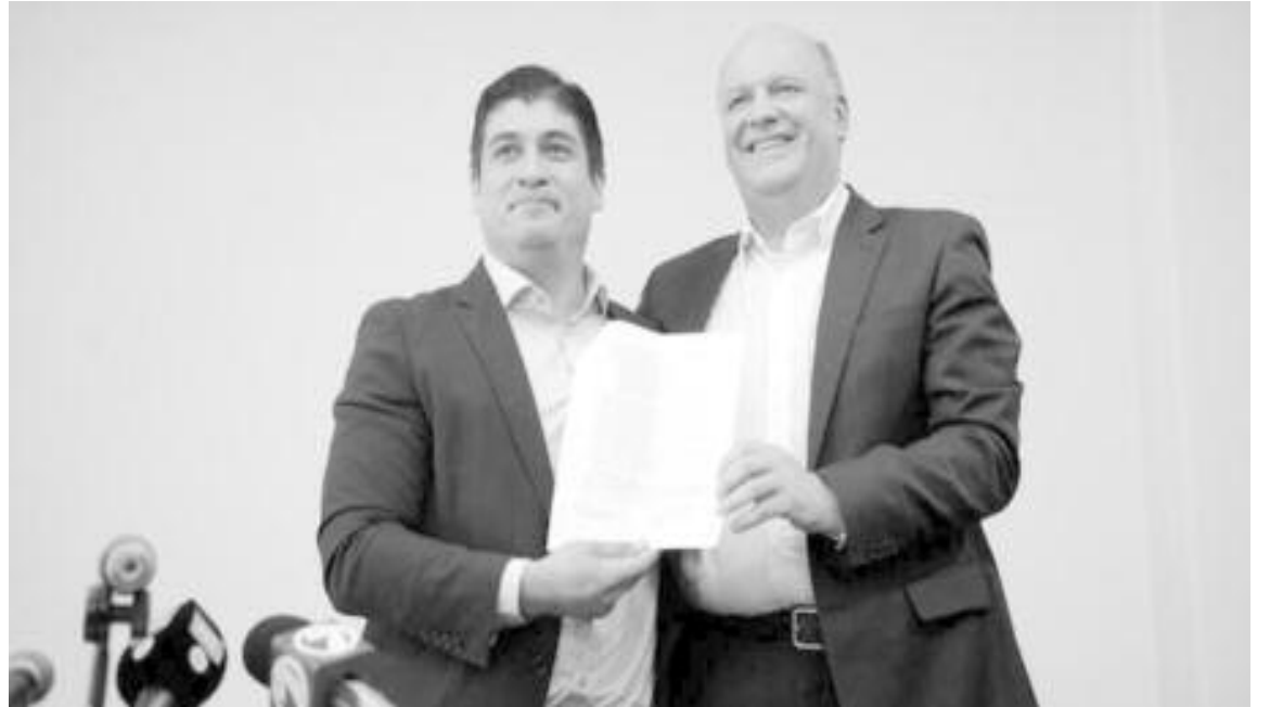
El acuerdo entre Carlos Alvarado y Rodolfo Piza contiene ataques a la clase trabajadora del sector público, aumento de impuestos indirectos y otras medidas regresivas.

Es así que plantea exonerar temporalmente de sus aportes a FODESAF y al IMAS a las nuevas pequeñas empresas. Estas contribuciones son las que financian los comedores escolares, al PANI, el INAMU, etc. También proyecta revisar la solidez financiera del IVM y el SEM, lo que eventualmente podría significar aumentar la